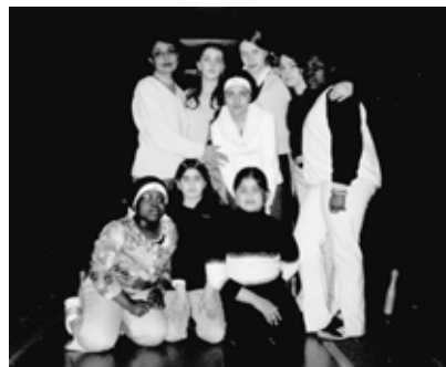
Mädchengruppe im HdJ Montags 12-21 Uhr کاروسل و جشنها (۳ تا ۵) هر روز Basteln im HdJ Dienstags 15-17 Uhr