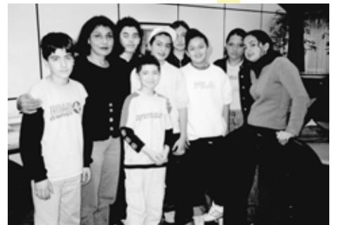
Persischkurs für Kinder und Jugendliche Mittwochs im HdJ 16-18 Uhr آموزش زبان فارسی برای کودکان و نوجوانان توسط خانم محبوب حریقیان نوجوانان تدریس می‌شود. شرایط بازگشت به ۳ و بعد از ظهر