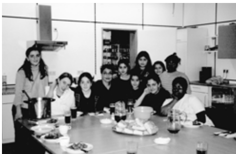
دوره آشپزی (دانشگاهها ۳ تا ۵ پیراز نظر) Kochkurs im HdJ Dienstags 15-17 Uhr

Das Mädchenfest wird veranstaltet vom Mädchenarbeitskreis Hamburg-Mitte mit freundlicher Unterstützung vom Jugendamt Hamburg-Mitte